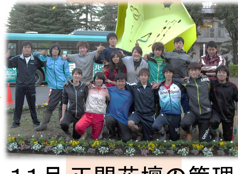
11月 正門花壇の管理