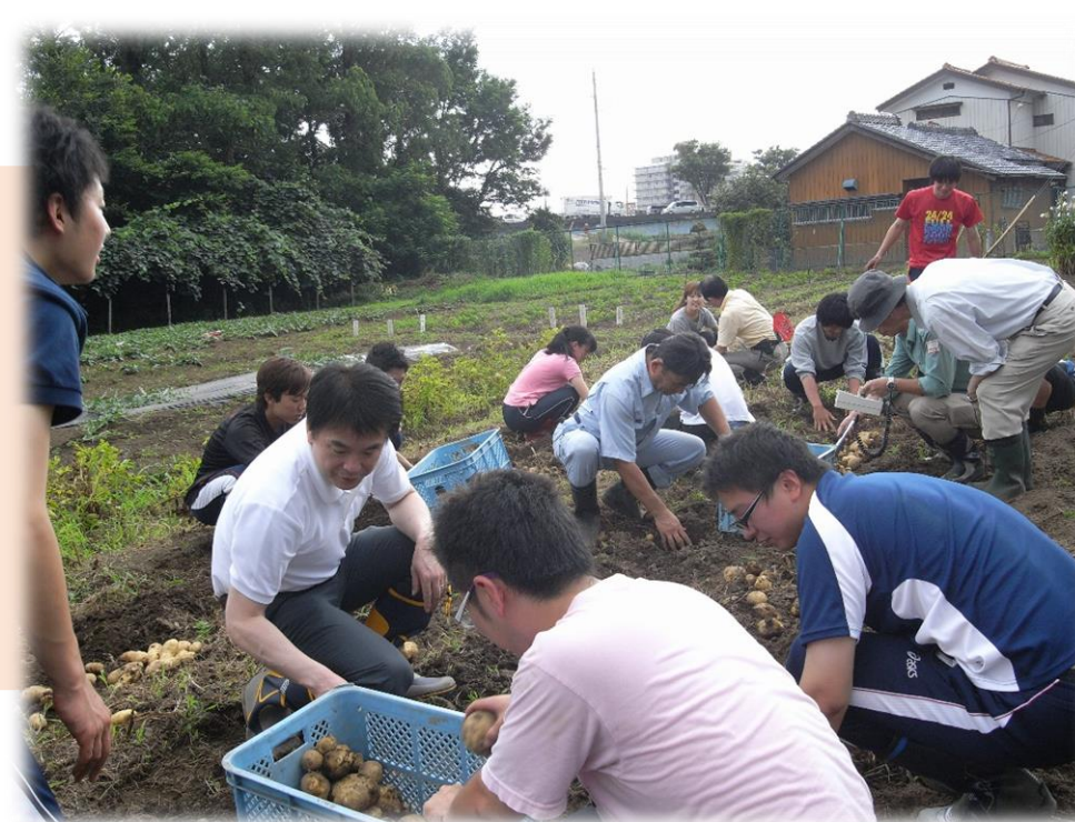
7月 ジャガイモの収穫