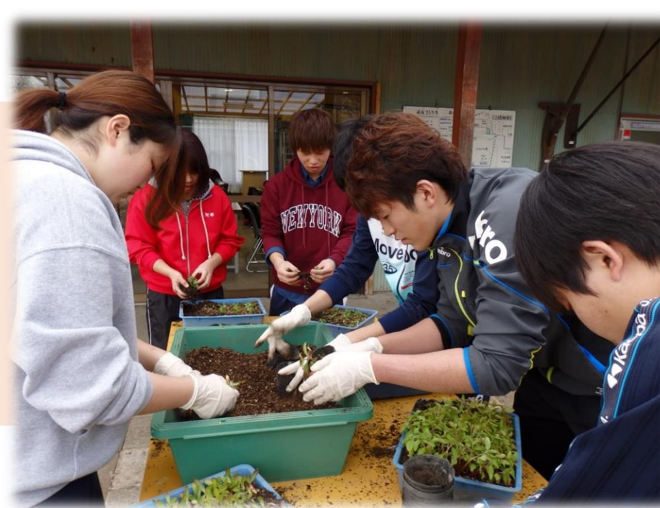
1月 草花の植え替え