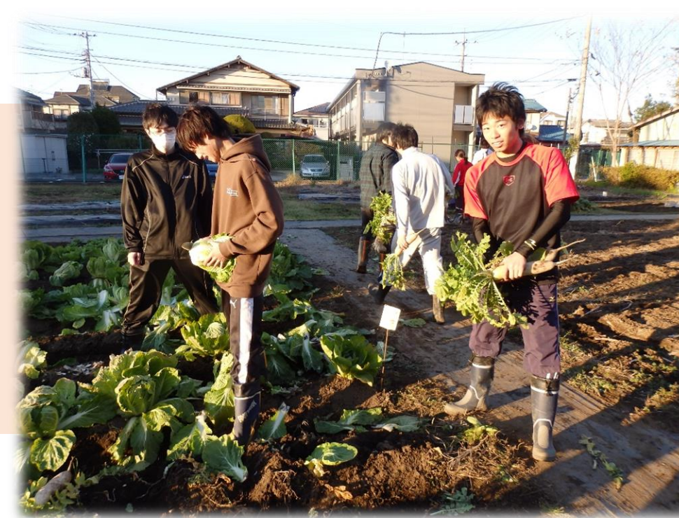
12月 ダイコンの収穫