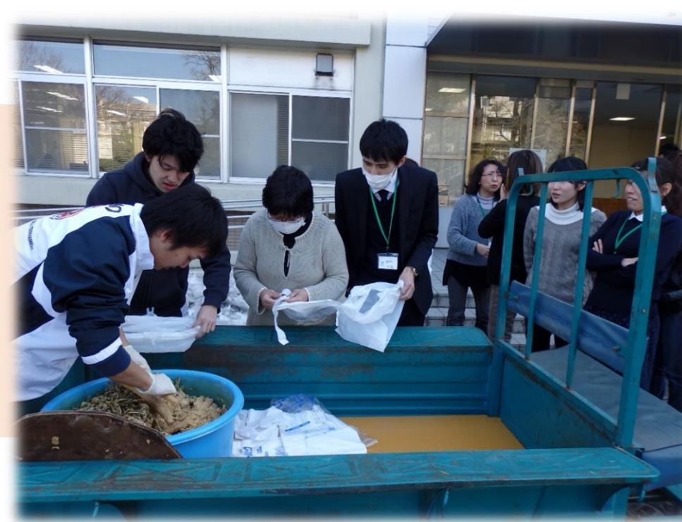
2月 タケノコの販売