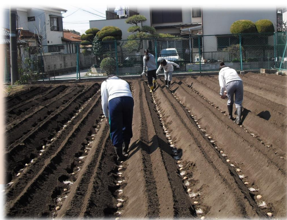
3月 ジャガイモの植付け