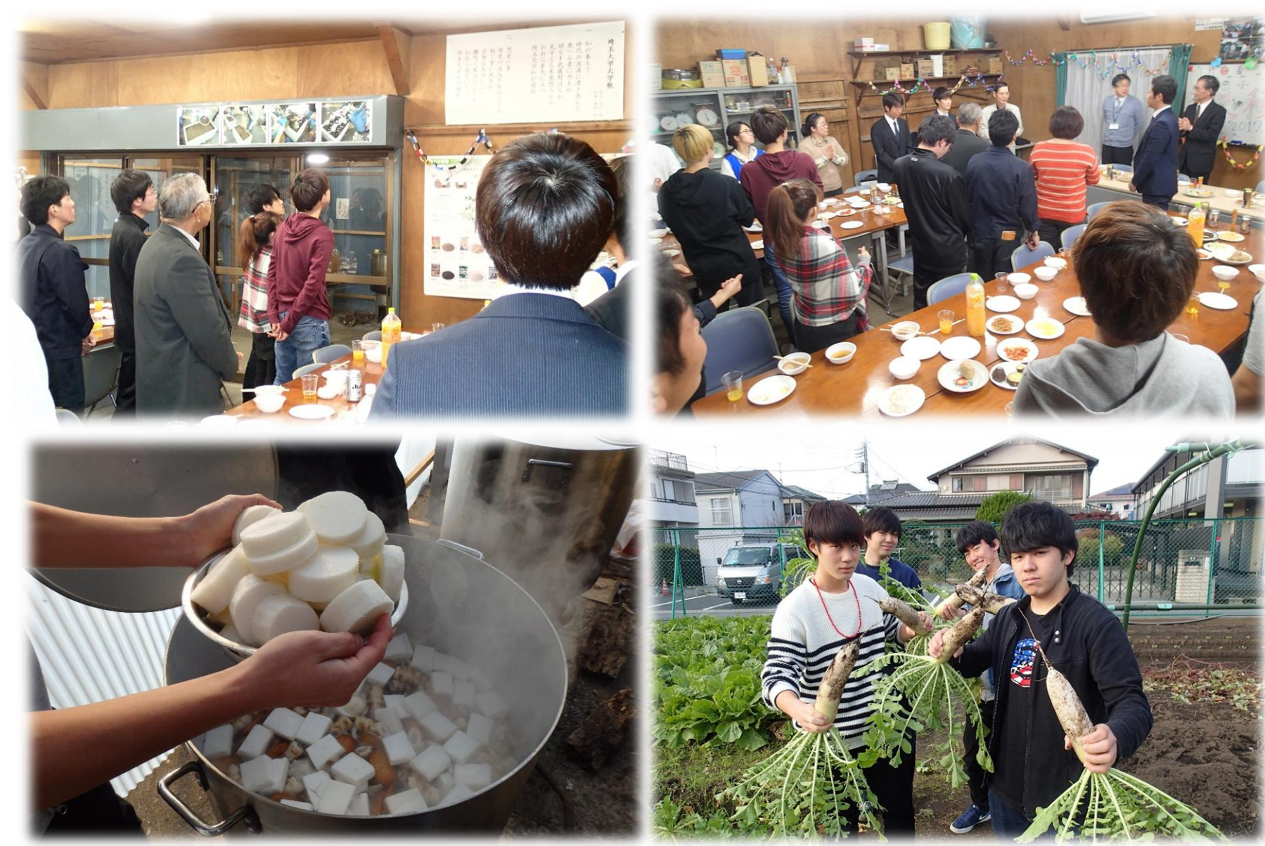
第37回教育学部大久保農場収穫祭のようす(2017年)