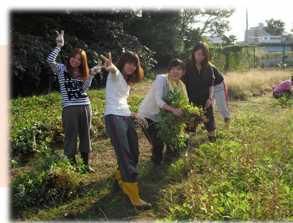
9月 ラッカセイの収穫