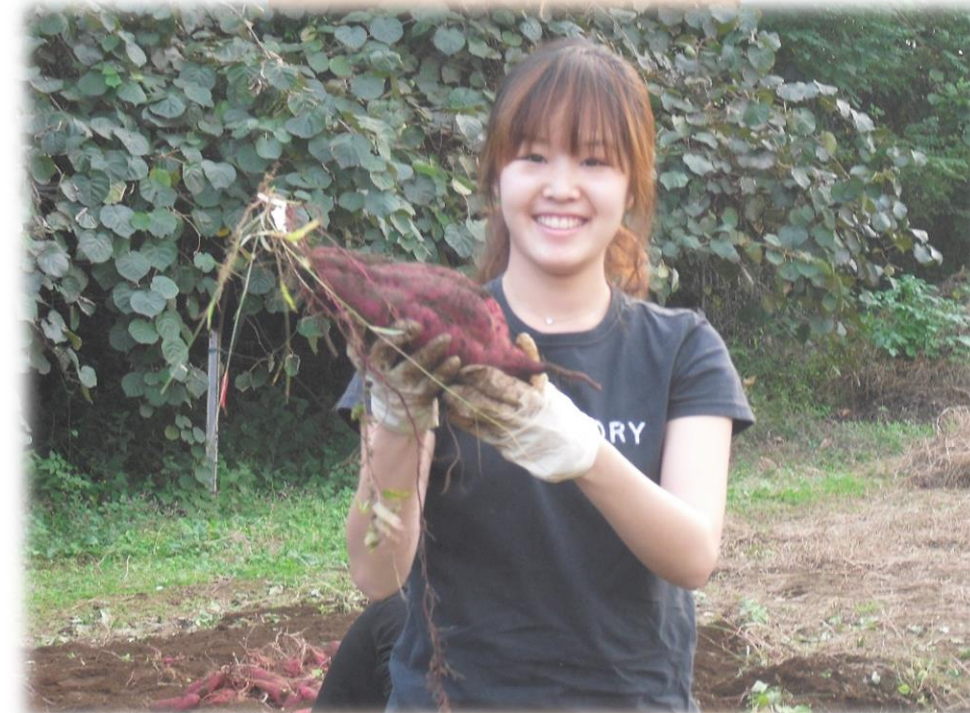
10月 サツマイモ収穫