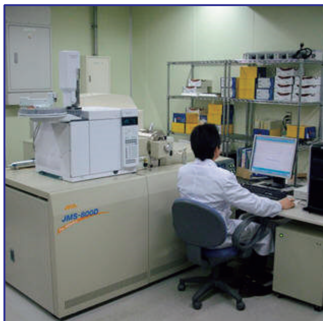
高分解能GC/MS装置によるダイオキシン分析の様子