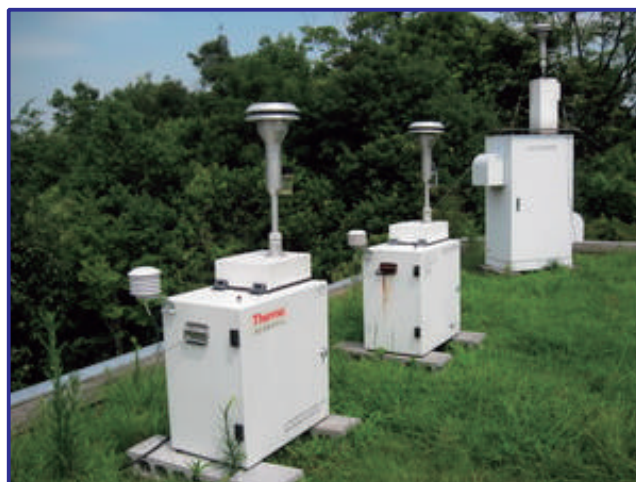
微小粒子状物質測定装置によるPM2.5の観測