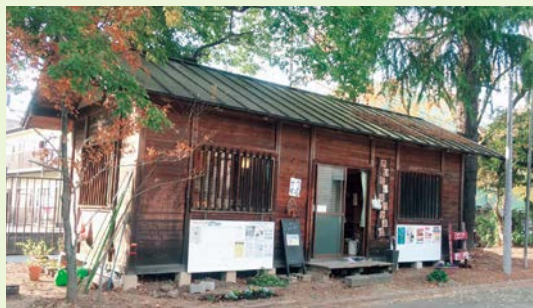
「さいだい交流ひろば」は小さな木の家

「さいだい交流ひろば」では、埼玉県内外の多種多様なボランティア活動や大学周辺の地域情報を揃えています。学生のうちに何かやりたい人、新しい価値観に触れてみたい人、ボランティア活動に関心のある人は、第2食堂裏手の小さな木の家においでください。ひろばでは、学部や学年を超えた交流ができます。さまざまな方と出会い、ふれ合い、語り合うことで、教室との講義とはひと味違う時間を過ごしてみませんか。