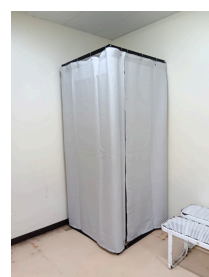
更衣室内に設置された 個別の更衣ブース

引き続き、関係部局等と連携しながら、大学環境改善や埼玉大学構成員の意識啓発に取り組んでまいります。