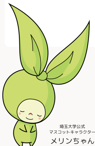
埼玉大学公式 マスコットキャラクター メリンちゃん

引き続き、関係部局等と連携しながら、大学環境改善や埼玉大学構成員の意識啓発に取り組んでまいります。