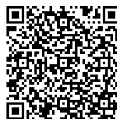
実演実技披露申込サイト

昼休みの実演・実技披露については、以下のとおりと実施可能とします。希望する団体は、希望する日時および場所を右のQRコードの申請サイトへ進み申請してください。併せて、実演・実技披露の概要及びその際の感染対策について記入して提出ください。内容を審査のうえ受付し、複数の団体が希望する場合には抽選にて決定します。