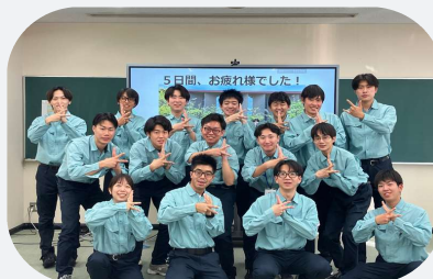
過去インターンシップ風景

その他コースも 実施いたします！ 皆様のご参加を心より お待ちしております(^^)