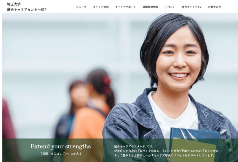
就職支援 WEB サイトの TOP ページ